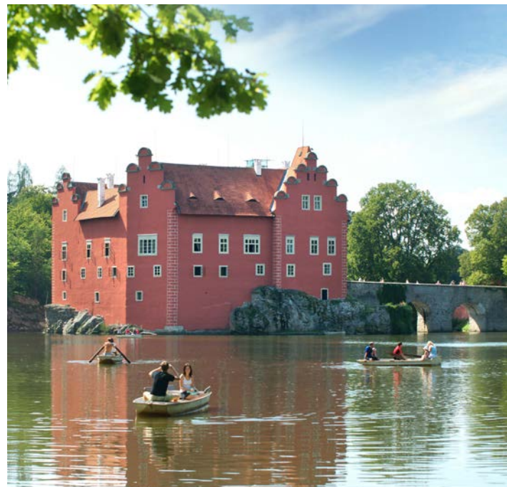
← Miasto Písek ↑ Pałac Červená Lhota ↓ Kościół pielgrzymkowy Klokoty